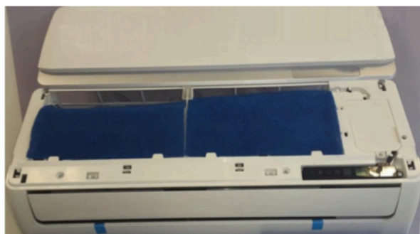
Instalado en unidad interior Split